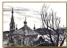
ハリストス教会堂 加藤 恵子 作