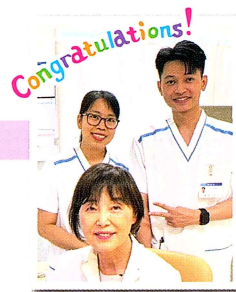
前列 理事長、 後列左 ロアン、右 ビエツ

2023年2月に行われた第112回看護師国家試験において、当院に勤務するEPA看護師候補者の3名が合格いたしました。