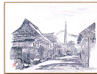
集落の春 加藤 恵子 作